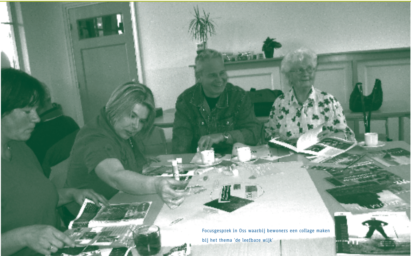
Focusgesprek in Oss waarbij bewoners een collage maken bij het thema 'de leefbare wijk'

Groningen in Oss kwam wonen, vanwege het werk van haar man: